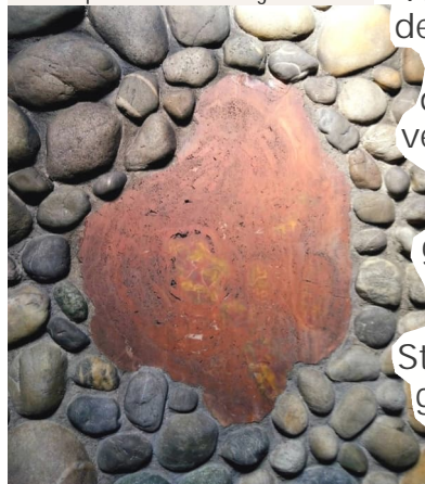
Marienkapelle in St. Maria Regina

Kommt zu ihm, dem lebendigen Stein, der von den Menschen verworfen, aber von Gott auserwählt und geehrt worden ist! Lasst euch als lebendige Steine zu einem geistigen Haus aufbauen.