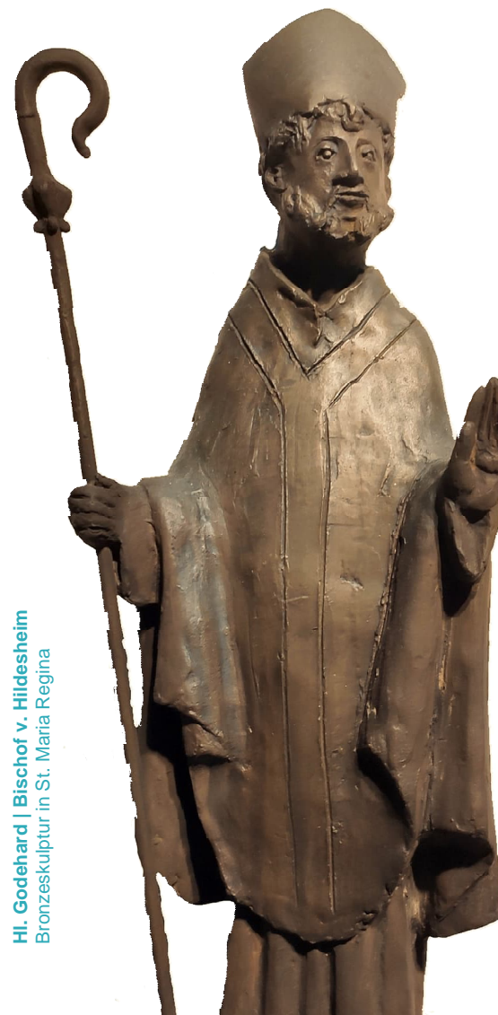
Hl. Godehard | Bischof v. Hildesheim Bronzeskulptur in St. Maria Regina