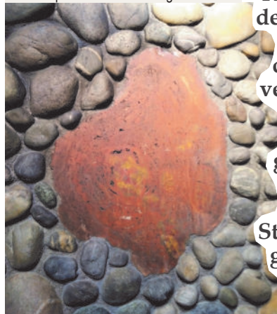
Marienkapelle in St. Maria Regina

Kommt zu ihm, dem lebendigen Stein, der von den Menschen verworfen, aber von Gott auserwählt und geehrt worden ist! Lasst euch als lebendige Steine zu einem geistigen Haus aufbauen.