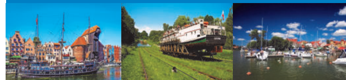
Danzig Schiffahrten: Oberländer Kanal + Spirdingsee (Mikołajki)

Der Norden Polens und Masuren sind abwechslungsreich und interessant: herrliche Landschaften und prächtig restaurierte Städte sind Ihre Reisebegleiter. Entdecken Sie das tausendjährige Danzig, die attraktive Hansestadt, folgen Sie den Spuren des Deutschen Ordens in Marienburg und genießen Sie die landschaftliche Schönheit von Masuren!