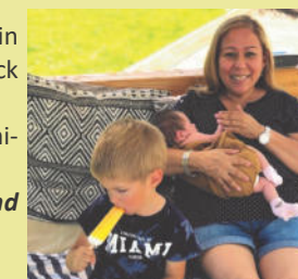
Zeit für die Enkelkinder...