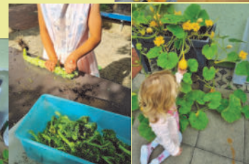
Bilder: J. Schulz